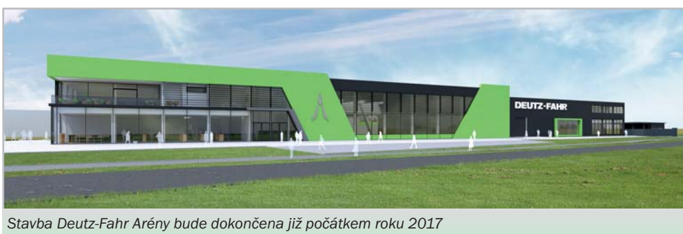
Stavba Deutz-Fahr Arény bude dokončena již počátkem roku 2017

Na velkolepé akci v německých Drážďanech, která proběhla letos v červnu, představil Deutz-Fahr novou generaci traktorů řad 6 a 7. Nové modely ztělesňují kombinaci těch nejmodernějších německých traktorových technologií spolu s prvotřídním komfortem a jednotným nezaměnitelným