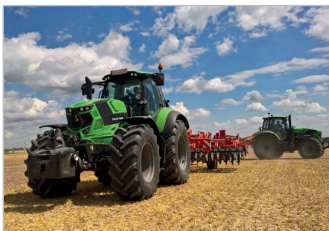
Na akci Budoucnost zemědělství 2016 v německých Drážďanech představil Deutz-Fahr novou generaci řad 6 a 7